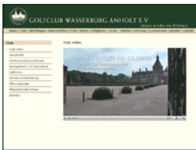
Der Anholter WebFilm