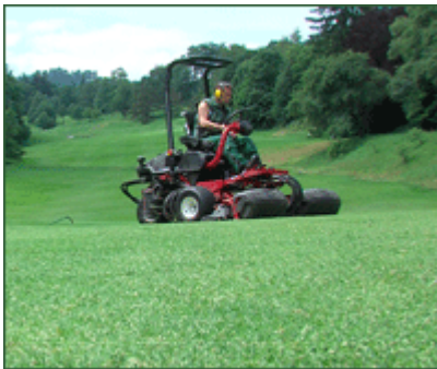
Filmeinsatz in Baden-Baden

Das zeitgleich mit der German Boys & Girls Open vom Trainerteam des Golf Club St. Leon-Rot betreute Sommercamp fügt sich in die vielfältige Palette der Jugendförderprogramme dieses nicht nur in Sachen Leistungsförderung vorbildlichen Golfclubs ein. In einem Vier-Minuten-Film hat unser Filmteam Impressionen vom Sommercamp festgehalten. In der Mediathek der "German Boys & Girls Open" können Sie sich alles ansehen.