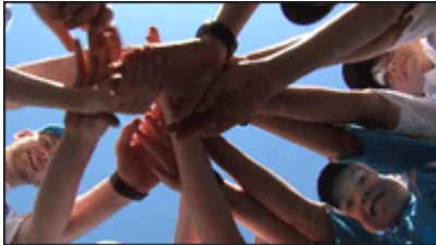
Lucky 33 Sommercamp