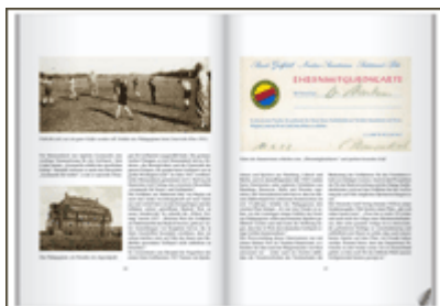
Jubiläumsschrift des Golf Club Föhr

Den Leitfaden finden Sie mit einem Klick hier .